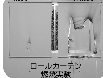
ロールカーテン燃焼実験