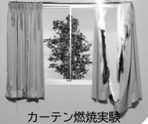
カーテン燃焼実験