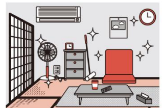
③火災の拡大を防ぐために、部屋を整理整頓し、寝具、衣類及びカーテンは、防災品を使用する