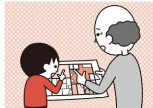
⑤お年寄りや身体の不自由な人は、避難経路と避難方法を常に確保し、備えておく