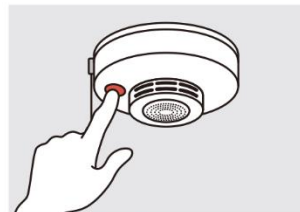
②火災の早期発見のために、住宅用火災警報器を定期的に点検し、10年を目安に交換する