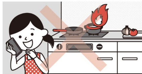
③こんろを使うときは火のそばを離れない