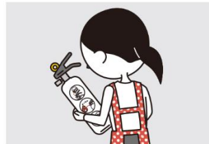
④火災を小さいうちに消すために、消火器等を設置し、使い方を確認しておく