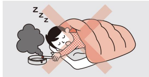
①寝たばこは絶対にしない、させない