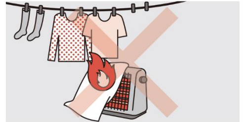
②ストーブの周りに燃えやすいものを置かない