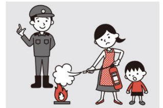
⑥防火防災訓練への参加、戸別訪問などにより、地域ぐるみの防火対策を行う