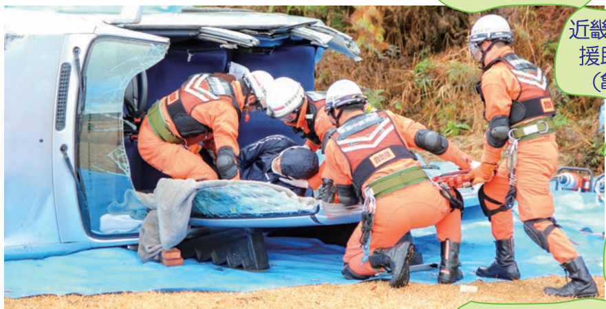
亀岡市立病院 消防訓練 (亀岡消防署)