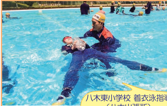
八木東小学校 着衣泳指導 (八木出張所)