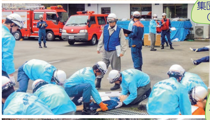
集団救急対応訓練 (園部消防署)