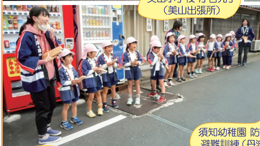
須知幼稚園 防火パレード 避難訓練 (丹波出張所)