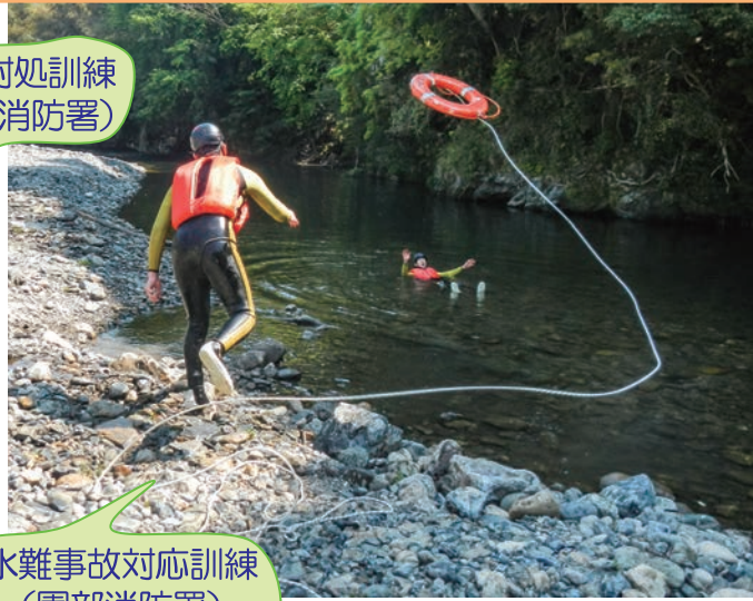
水難事故対応訓練 (園部消防署)