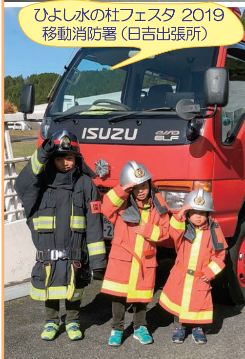
ひよし水の杜フェスタ 2019 移動消防署 (日吉出張所)