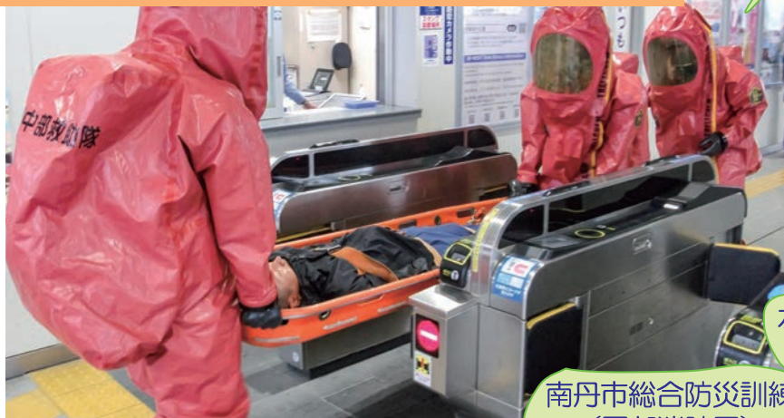
南丹市総合防災訓練 (園部消防署)