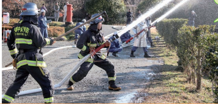
かやぶきの里 文化財消防訓練 (園部消防署)