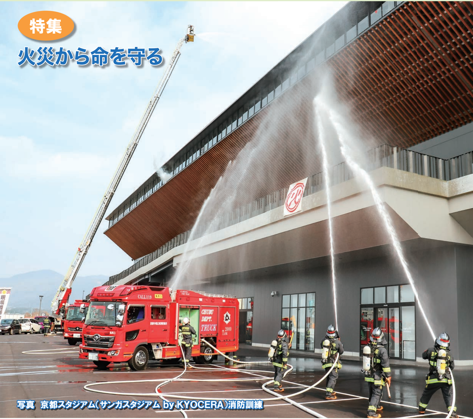
写真 京都スタジアム(サンガスタジアム by KYOCERA)消防訓練