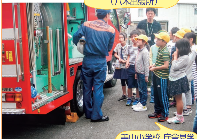
美山小学校 庁舎見学 (美山出張所)