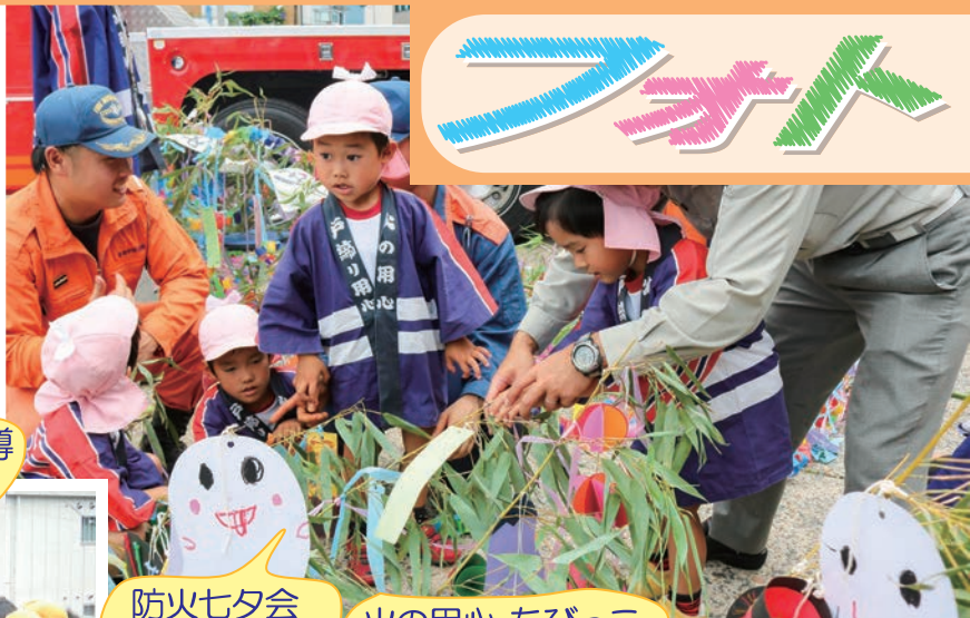
防火七夕会 (亀岡消防署)