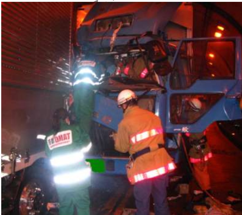
写真▲：交通事故現場への出動要請を受けたDMATの隊員は、消防隊、救急隊、救助隊と協同して、負傷者の処置を実施します。

京都中部広域消防組合管内では、公立南丹病院が災害拠点病院に指定されており、DMATを有しています。現在、厚生労働省の研修を受けた医師・看護師・臨床工学技士・事務員が日本DMATの隊員として登録されており、消防と連携して活動を実施します。