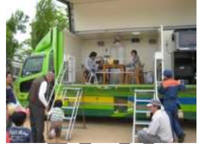
模擬地震の体験 （2009 丹波ちびっこまつり）