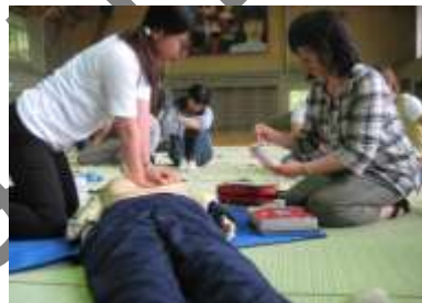
家族を助ける心肺蘇生法の訓練 （桧山小学校PTA）