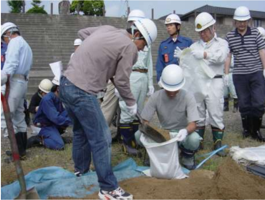
水害に備えた水防訓練（南丹市八木町）