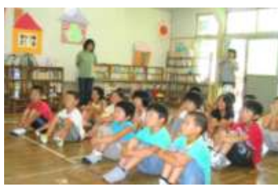
移動消防署（胡麻放課後児童クラブ）