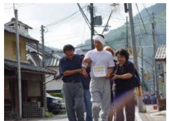
写真：京都府総合防災訓練（京丹波町須知地内）

このような状況では、近くにいる皆さん一人ひとりの「力」が大切になります。ひとりでは、何もできなくても、家族や仲間、そして、まちのみんなが集まって協力しあえば、被害を最小限にすることができます。