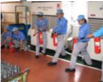
自衛消防訓練（イトン機器㈱）