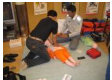
救急広場での心肺蘇生法の訓練 （南丹市園部町）