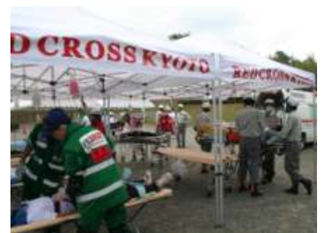
写真▲：京都府総合防災訓練での活動状況

救急隊は、傷病者の症状に適した最も近くの医療機関に搬送しますが、多数の負傷者が発生した場合には、分散して搬送したり、管轄外の医療機関にも搬送することがあります。