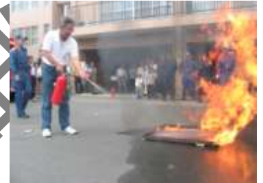
自主防災会の初期消火訓練 （亀岡市篠町）