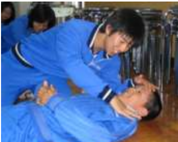
仲間を助ける心肺蘇生法の訓練 （美山中学校）