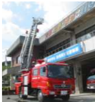
特殊装備隊「はしご付消防自動車」