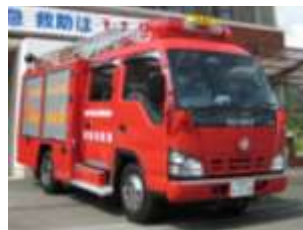
消火隊「消防ポンプ自動車」