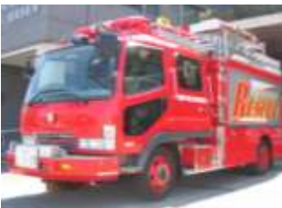
救助隊「救助工作車」