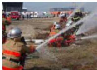
全国の隊員が協同で消火活動を実施（写真：左手前「京都中部広域消防組合の消火隊」）