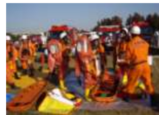
全国の隊員が協同で特殊災害時の救出活動を実施（写真：中央「京都中部広域消防組合の救助隊」）